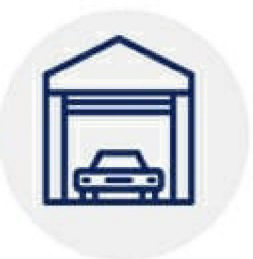
ГАРАЖ ИЛИ МАШИННОЕ МЕСТО

(не более 0,25 га общей площадью в городских или 1 га в сельских поселениях )